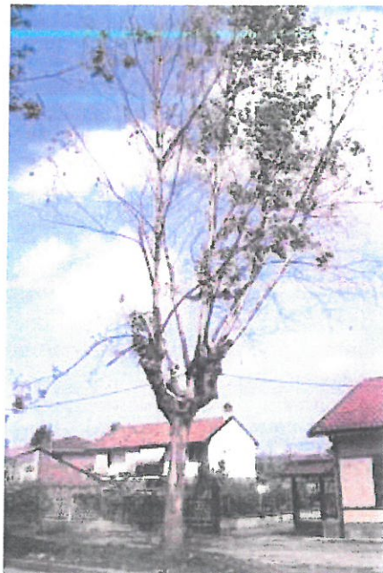
REGIONE LOMBARDIA - Servizio Fitosanitario Regionale

La lésion progresse vers le sommet de l'arbre, par des tissus nécrosés, jusqu'à recouvrir toute la hauteur du tronc : la lésion est de couleur bleue violacée, bordée d'un liseré brun clair à brun orangé.